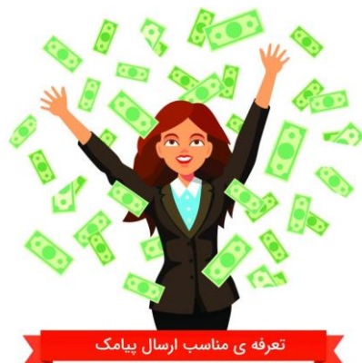
تعرفه ی مناسب ارسال پیامک

تجربه و سوابق کاری ما نشان می دهد که؛ بس یاری از کاربران در هنگام خرید پنل اس ام اس از این امکانات پنل تنها به تعرفه آن توجه می کنند و پایین بودن تعرفه، موجب نادیده گرفتن موارد دیگر می شود، اما از طرف دیگر بالا بودن تعرفه پنل، دلیل بر معتبر بودن و با کیفیت بودن سامانه نمی باشد و پایین بودن تعرفه ارسال پیامک و پنل پیامک دلالت بر بی کیفیتی سامانه و خدمات ارائه دهنده نمی باشد. شما باید در کنار تعرفه به کیفیت سا رذر ذ ذرمانه و دیگر امکانات و اللخصوص پشتیبانی آن توجه نمایید. بحث پشتیبانی یکی از مهم ترین موضوع در پنل پیامکی می باشد. شاید شما دیده باشید بعضی از سامانه‌ها، تعرفه پایین تری نسبت به اپراتورها ارائه می دهند و این در صورتی می باشد که شماره های تکراری و غیرفعال را حذف نمی کنند و این کار باعث می شود که تعرفه پایین را تلافی کنند.